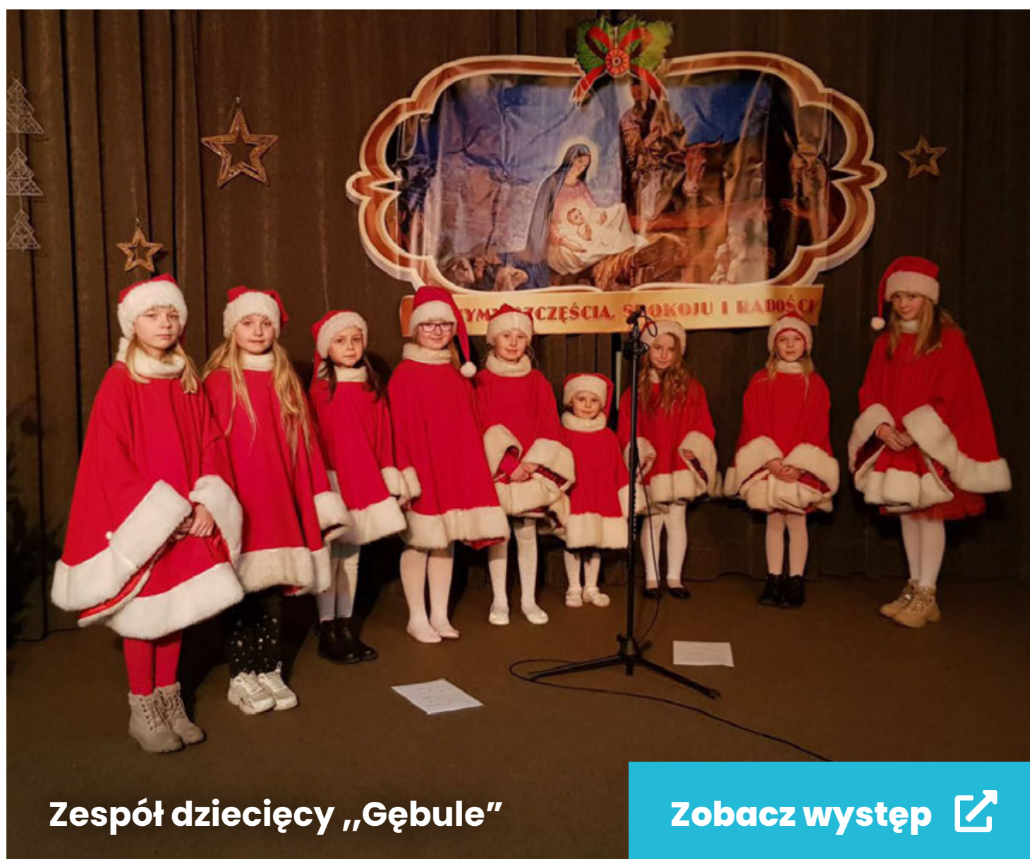
Zespół dziecięcy „Gębule”