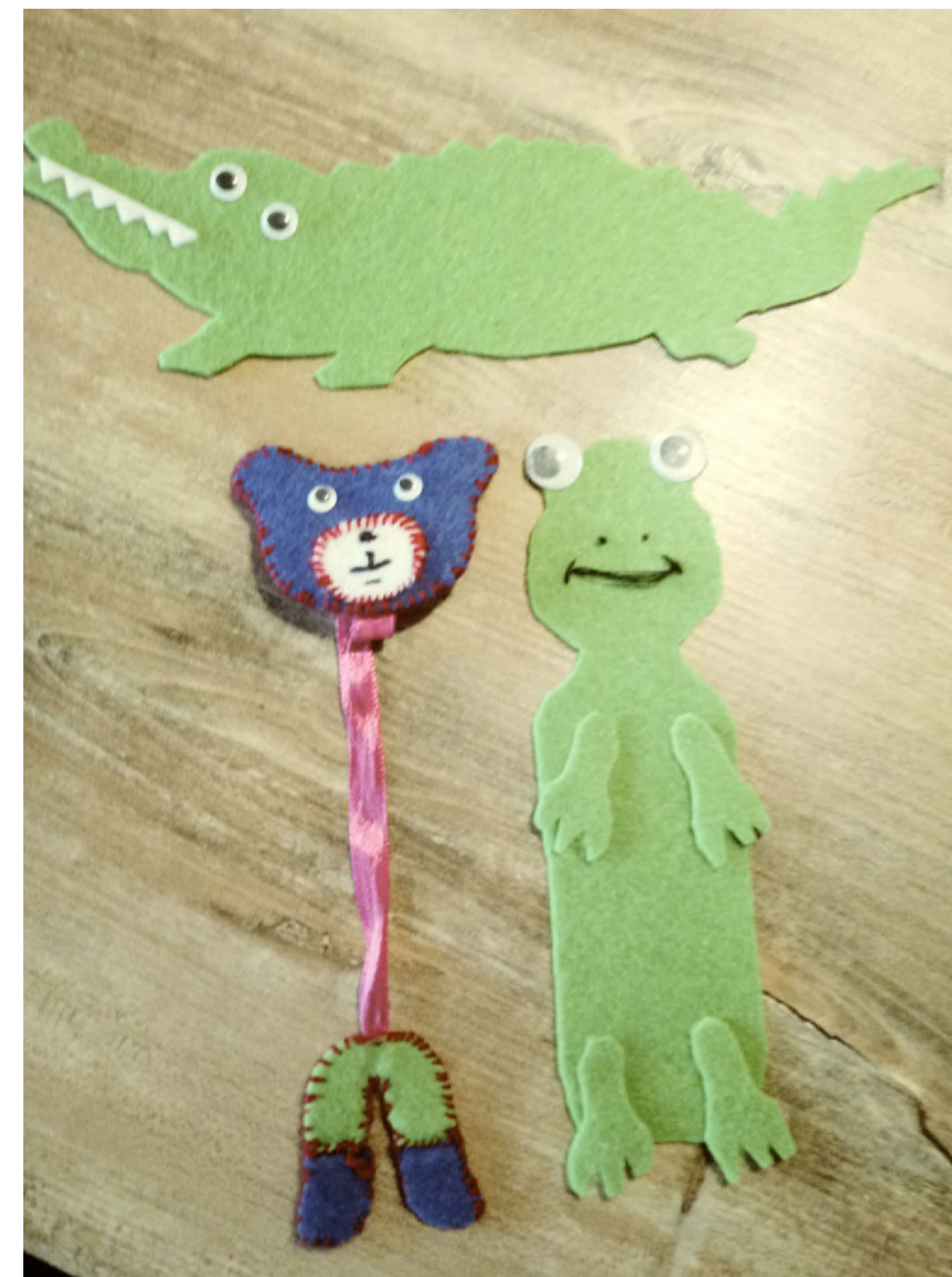
Wybrane prace nadesłane na konkurs #mojaZAKŁADKA