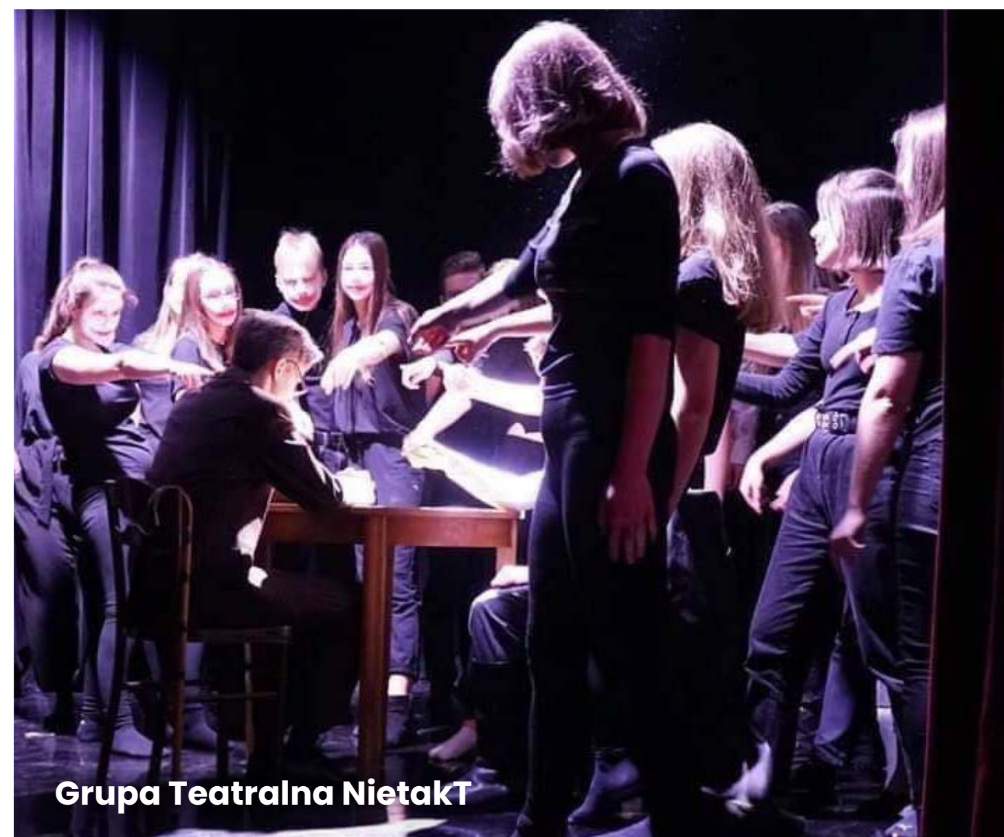
Grupa Teatralna Nietakt