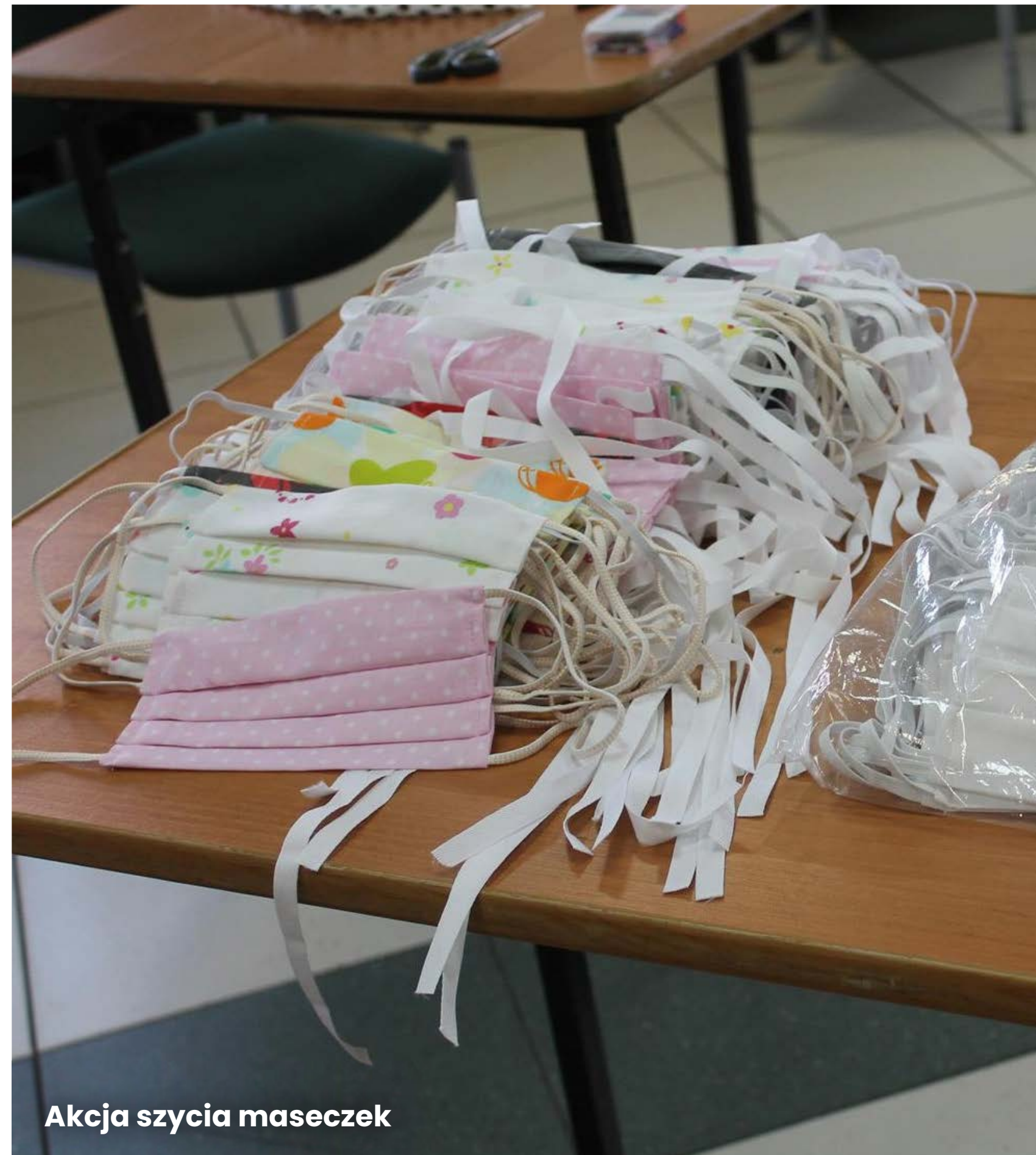
Akcja szycia maseczek