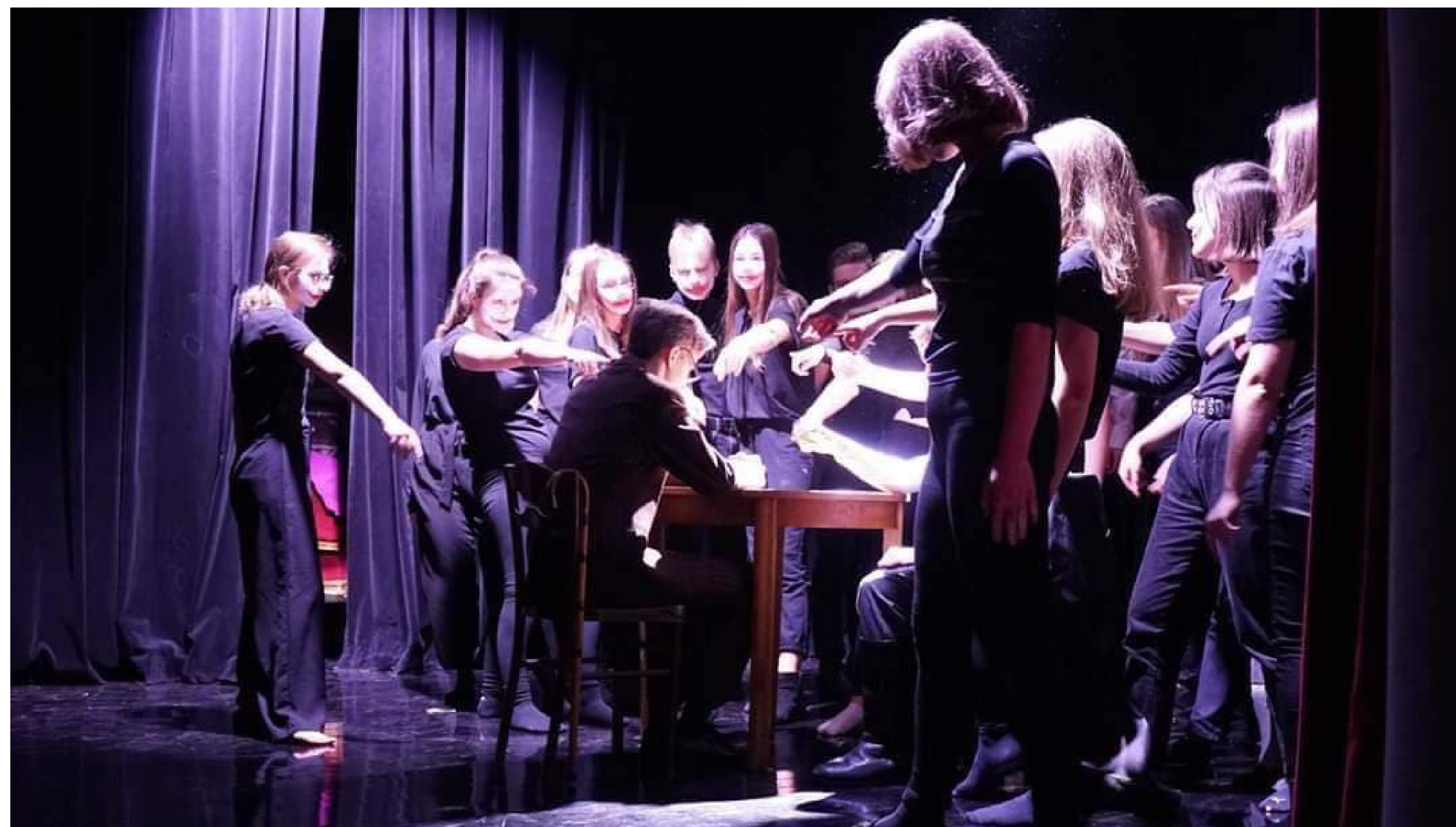
Grupa teatralna NietakT