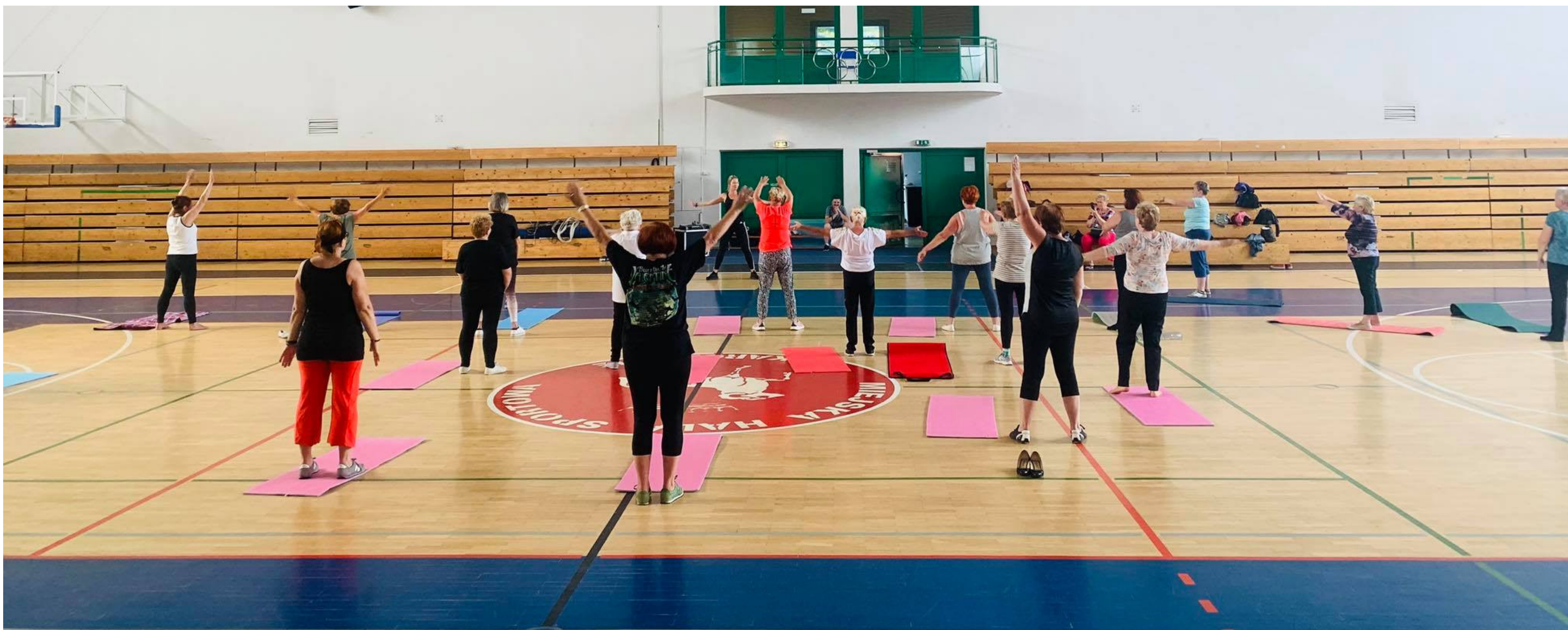
Zajęcia fitness dla seniorów