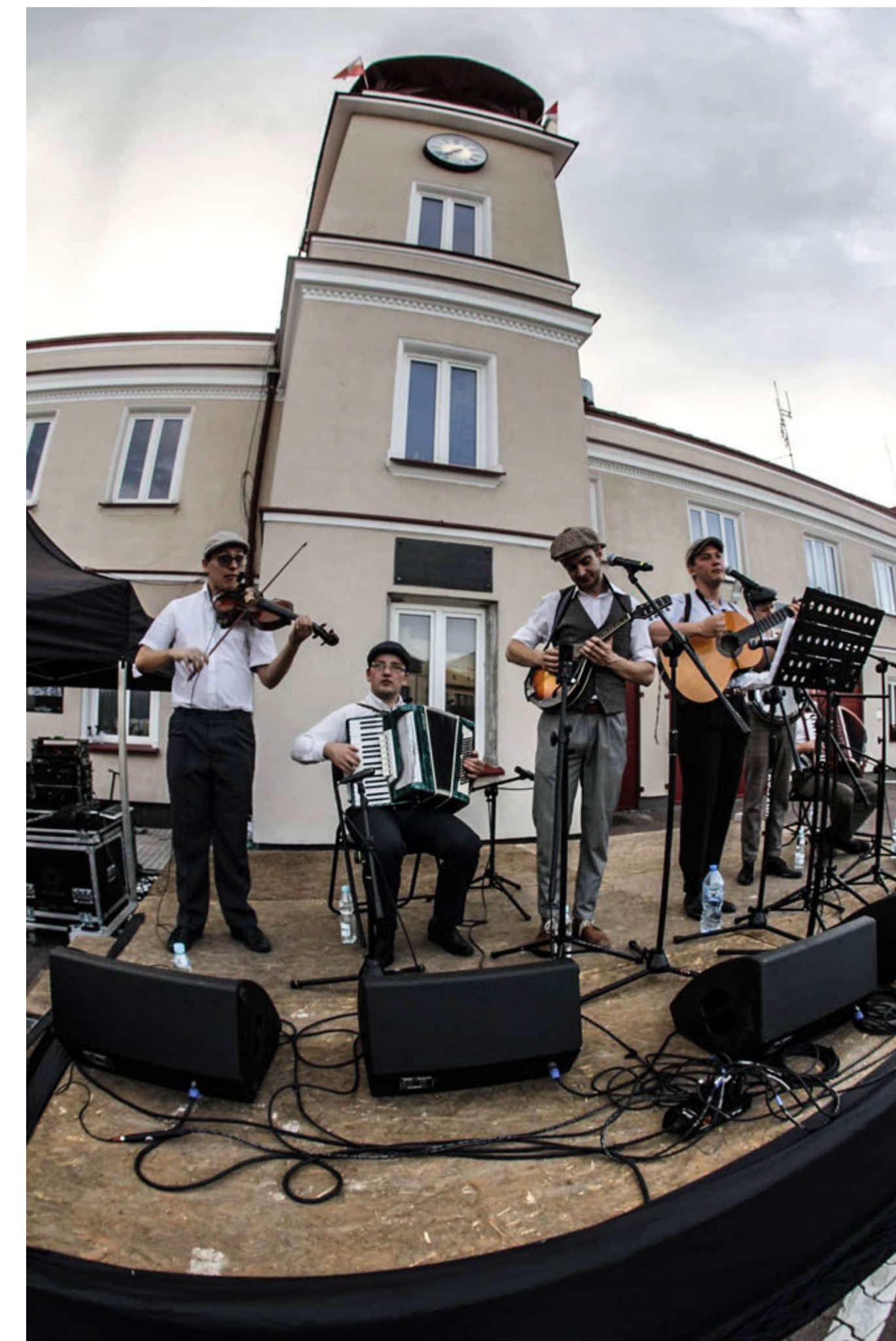
Koncert piosenek Powstańczej Warszawy z Kapelą Sztajer