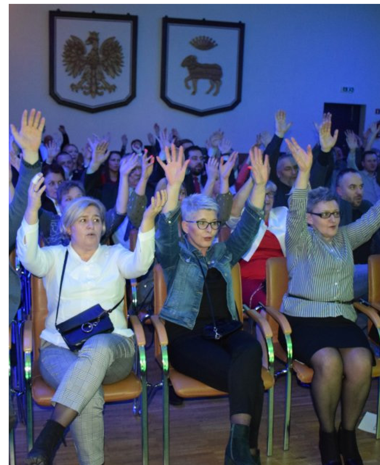
Koncert Noworoczny z zespołem "Od Święta"