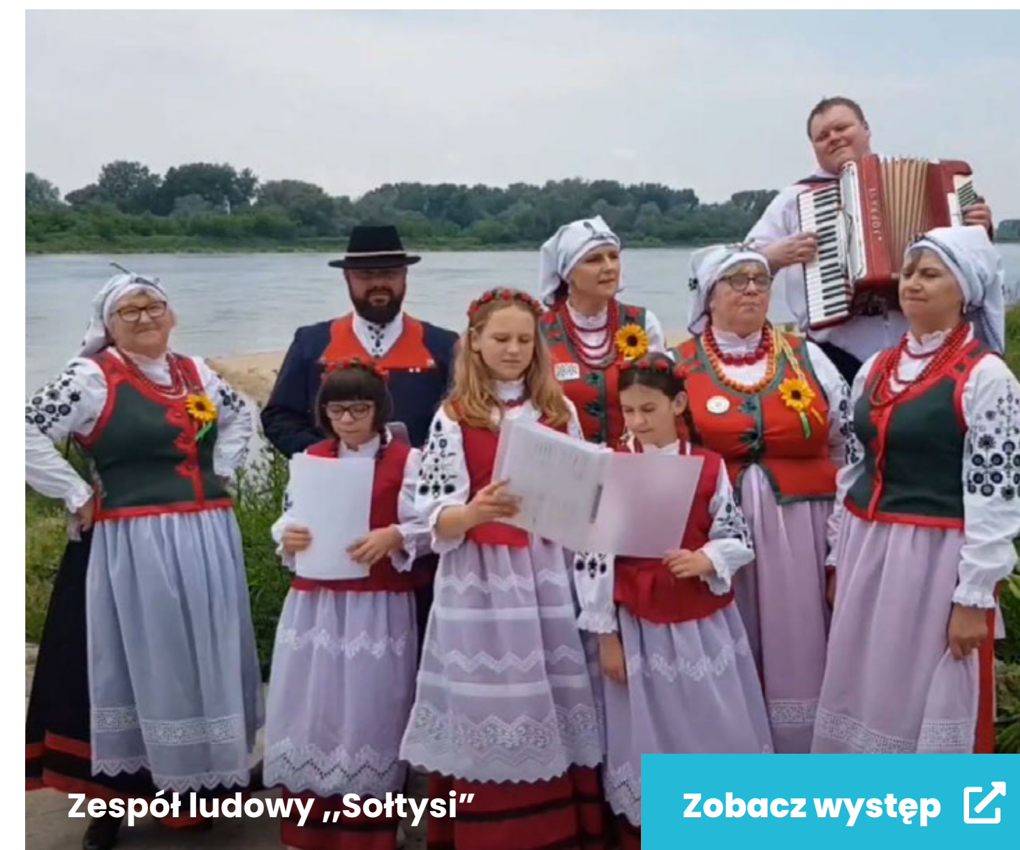
Zespół ludowy „Sołtysi”