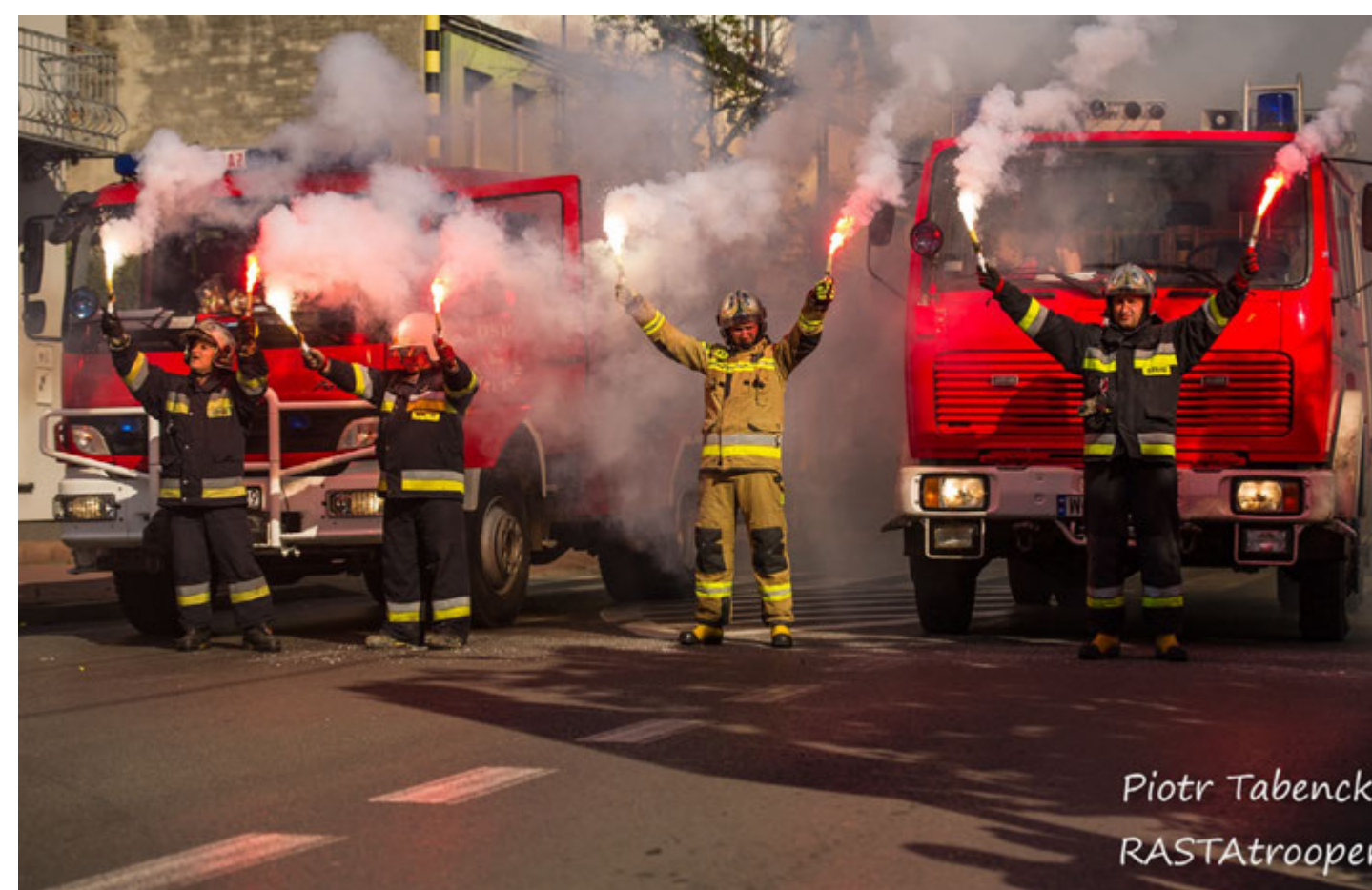
Piotr Tabencki RASTAtrooper