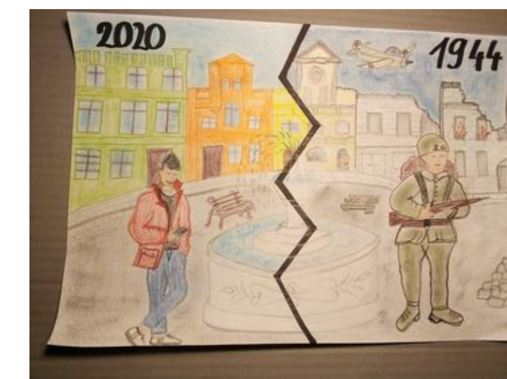
Wybrane prace nadesłane na konkurs #WspółczesnaNiepodległa