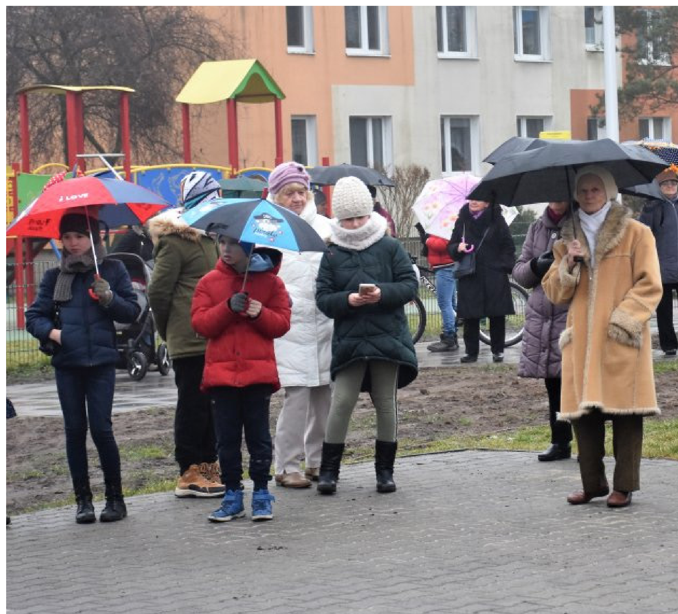
Wspólne kolędowanie Kapeli Góralskiej HORA z mieszkańcami Karczewa