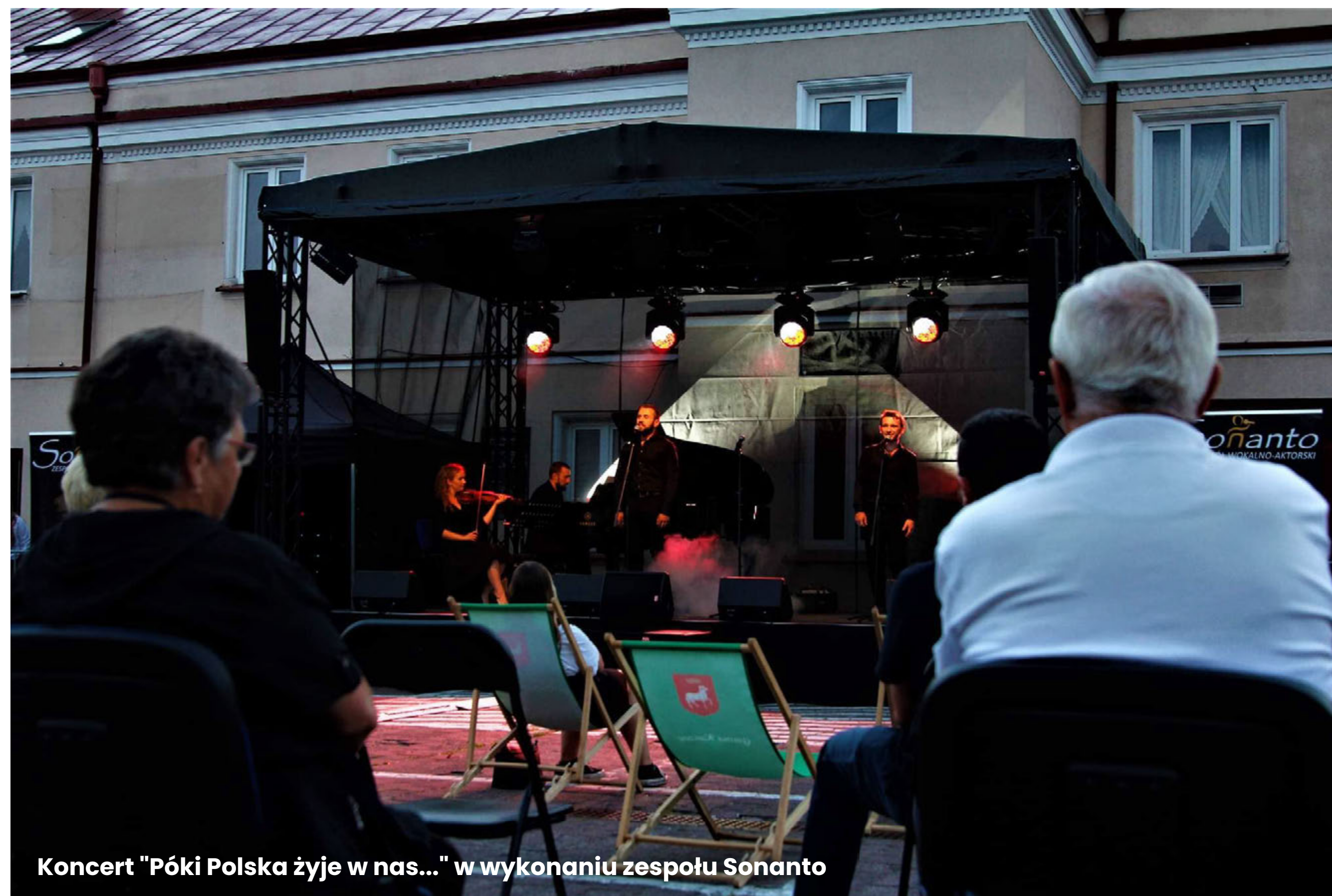
Koncert "Póki Polska żyje w nas..." w wykonaniu zespołu Sonanto